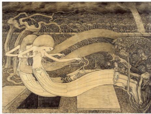
Jan Toorop: 'O graf, waar is je overwinning?' (Oh Grave, Where Is Thy Victory)

In minstens 11 vooraanstaande Nederlandse musea, waaronder het Groninger museum, hangen werken van Jan Toorop.